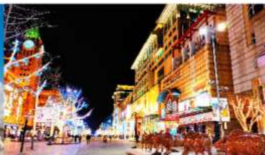
ถนนหวังฝูจิ่ง