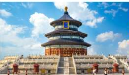
หอบูชาฟ้าเทียนถาน