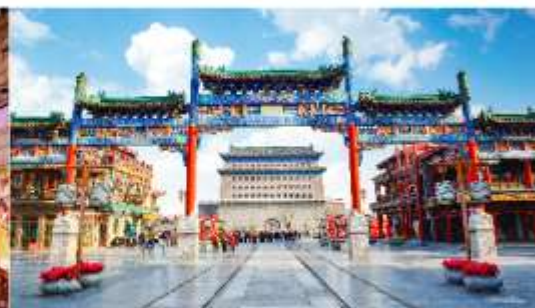
ถนนโบราณเฉียนเหมิน